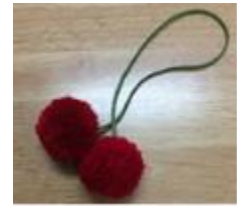
ぼんぼんストラップ 50円から