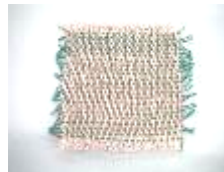
手織りのコースター 50円