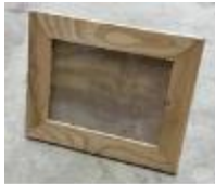
フォトフレーム 150円