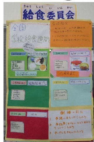
給食委員会メンバーによる掲示

大江校では、1月27日から1月31日までの5日間、 学校給食の節目となる出来事に沿った献立を提供しています。