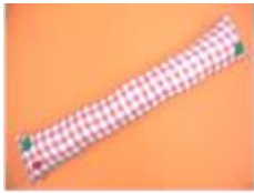
リストクッション 200円