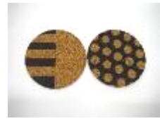
コースター 2枚で20円