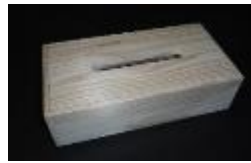
ティッシュボックス 500円