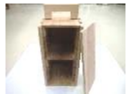
おかもちボックス 900円