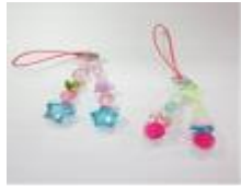
ストラップ 1個 50円