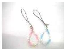
ストラップ 1個 50円