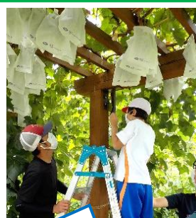
事前学習でパーゴラのぶどうをもぎ取り

コロナ感染症の予防対策を行いながらの体験でしたが、生き生きと活動する子供たちの姿に、地域みなさんに支えていただいていることに改めて感謝し、地域を知り、地域に関わって学習することの意義を強く感じた日となりました。