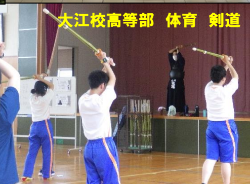
大江校高等部 体育 剣道