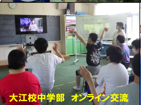
大江校中学部 オンライン交流