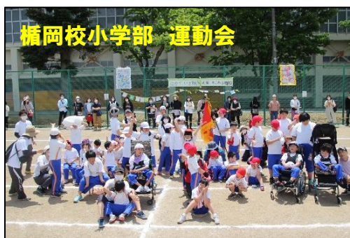
楯岡校小学部 運動会