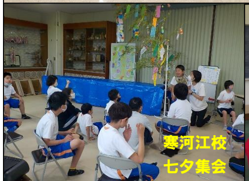
寒河江校 七夕集会