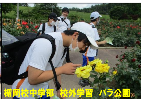
楯岡校中学部 校外学習 バラ公園