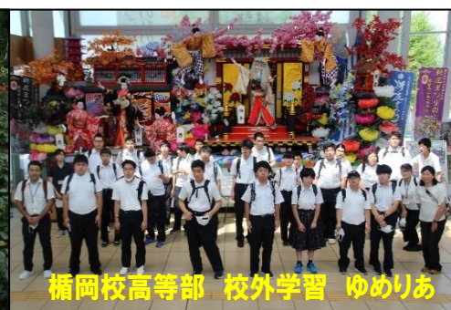
楯岡校高等部 校外学習 ゆめりあ