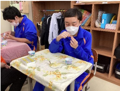
キーホルダー作り