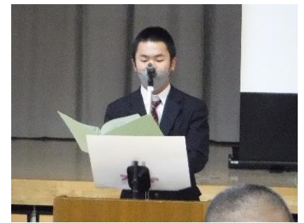
児童生徒会役員選挙 選挙管理委員を務めて