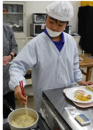
調理実習 ～ラーメン一丁～