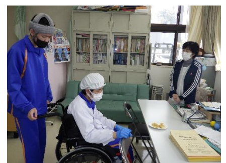
調理実習 ～たいやきどうぞ～