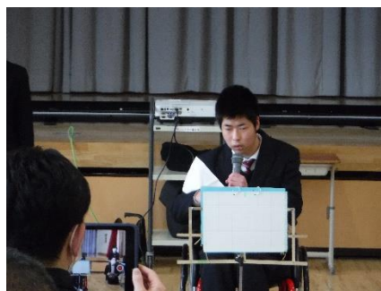
児童生徒会役員選挙立会演説会