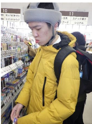
受検に必要な文房具を求めて